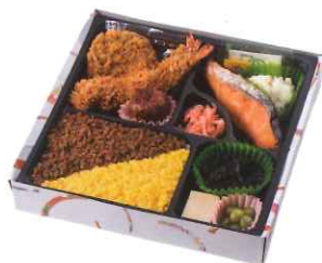
楓 〈かえで〉 1,600円(税込)