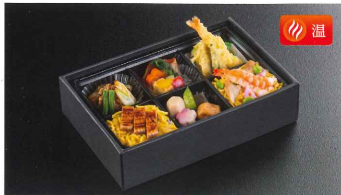
待雪草〈まつゆきそう〉 6,545円(税込)