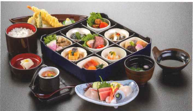
比叡〈ひえい〉 6,380円(税込)