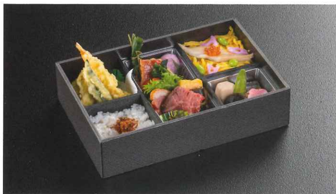
立葵〈たちあおい〉 4,565円(税込)