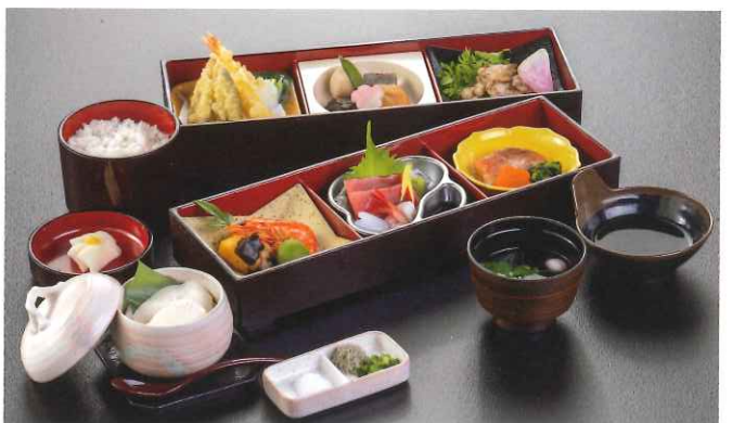
熊野〈くまの〉 4,400円(税込)