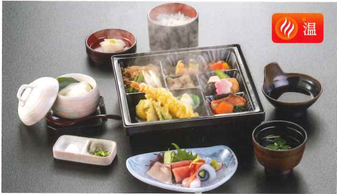
熱田〈あつた〉 6,380円(税込)