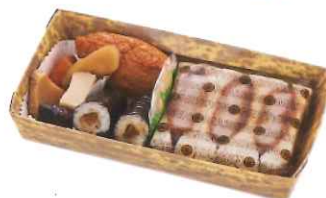
玉手箱 〈たまてばこ〉 696円(税込)