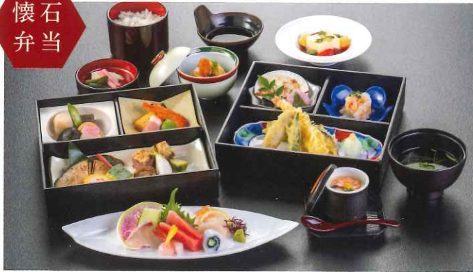
石清水〈いわしみず〉 9,680円(税込)