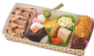
小町 〈こまち〉 1,000円(税込)