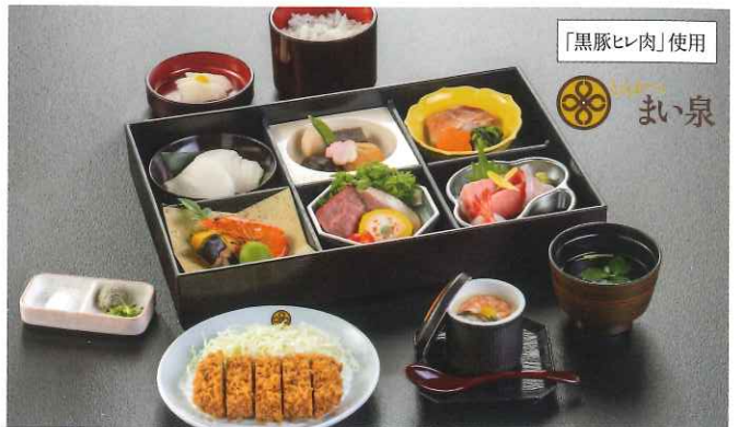
明神〈みょうじん〉 6,380円(税込)