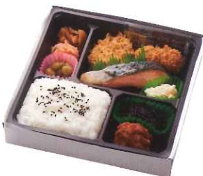
杏 〈あんず〉 1,200円(税込)