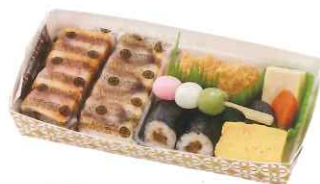
七福神 〈しちふくじん〉 1,000円(税込)