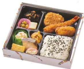
福 〈ふく〉 1,750円(税込)