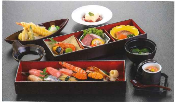
鞍馬〈くらま〉 7,480円(税込)