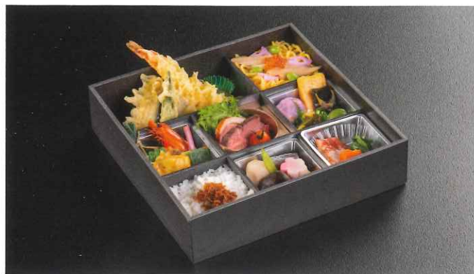
雛菊〈ひなぎく〉 5,445円(税込)