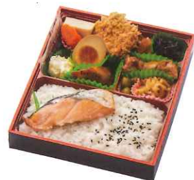
いろいろ弁当 950円(税込)