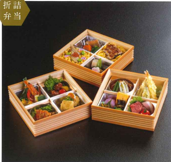
杜若〈かきつばた〉 7,645円(税込)